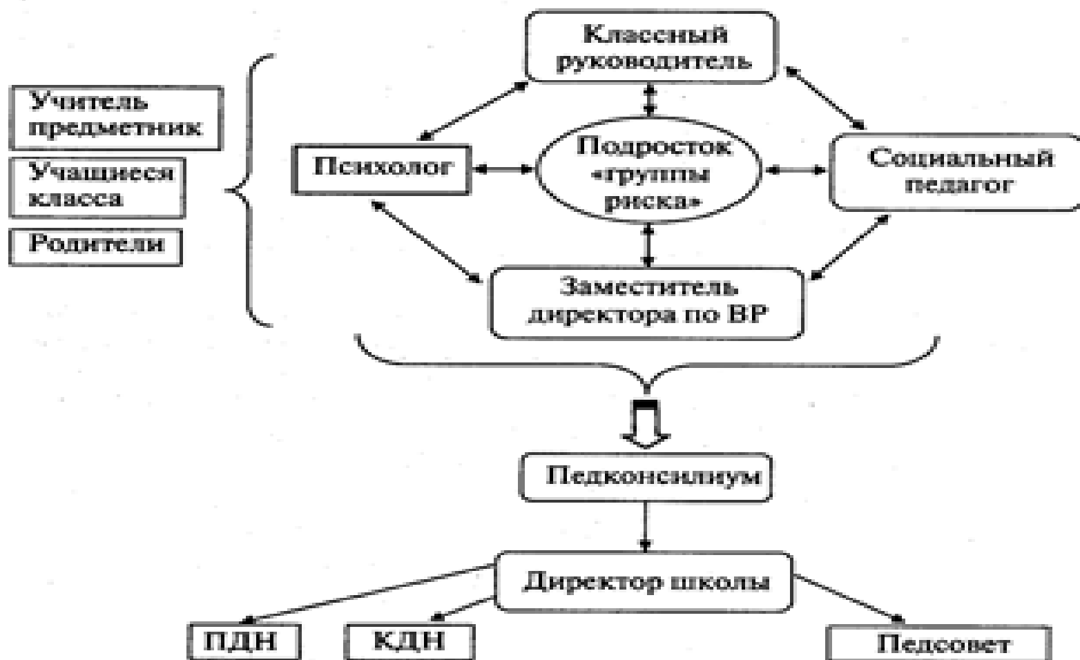
Схема взаимодействия специалистов образовательного учреждения

Взаимодействие специалистов в образовательном учреждении